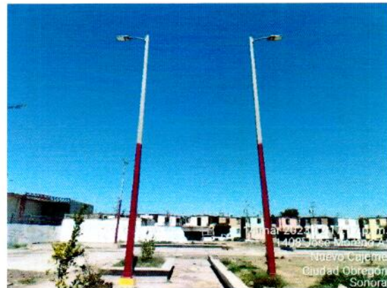
Proceso de aplicación de pintura esmalte a postes metálicos para iluminación.